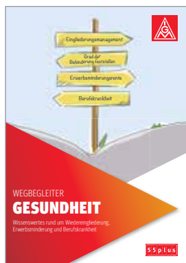
Broschüre DIN A4, Produkt-Nr. 40369-92404

Der Wegbegleiter bietet Informationen rund um das Thema Erwerbsminderungsrente und beantwortet Fragen zu Voraussetzungen, Antragsstellung, Fristen, Hinzuverdienst und vielem mehr.