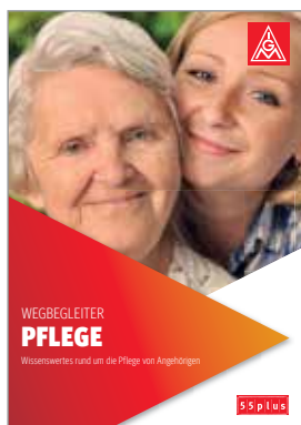
Broschüre DIN A4, Produkt-Nr. 47472-91207

Die IG Metall engagiert sich für sichere Arbeitsplätze, faire Löhne sowie eine gute soziale Absicherung. Sie unterstützt ihre Mitglieder bei Problemen in der Arbeitswelt, aber auch bei weitergehenden Fragen des Lebens. In der Wegbegleiter-Reihe werden Lebens- und Alltagsfragen wie Vorsorge, Rente, Gesundheit oder Pflege aufgegriffen. Dabei werden die Themen übersichtlich dargestellt und eine inhaltliche Orientierungshilfe gegeben.