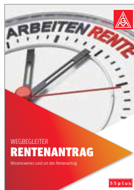
Broschüre DIN A4, Produkt-Nr. 29029-67804

Die zentralen Fragen rund um das Thema Pflege von Angehörigen werden im Wegbegleiter Pflege beantwortet. Er wird durch acht vertiefende Bausteine ergänzt: Teilzeit für Pflegenden, Antragstellung und Begutachtung, Pflegebedürftigkeit, Pflegegeld, Kurzzeit- und Tagespflege, Entlastungsbetrag, soziale Absicherung für Pflegenden, stationäre Pflege.