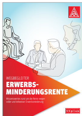
Broschüre DIN A4, Produkt-Nr. 45219-86534

Der Wegbegleiter Rente befasst sich mit allen wesentlichen Vorüberlegungen rund um den Renteneinstieg, den vorgezogenen Renteneinstieg und die jeweiligen Abschläge bis hin zum Thema Besteuerung der Rente sowie Unterstützungsleistungen, wenn die Rente nicht ausreicht.