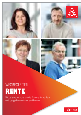
Broschüre DIN A4, Produkt-Nr. 40370-75285

Der Wegbegleiter bietet Hilfeleistung zur Vorbereitung des Rentenanspruchs. Themen sind unter anderem: Antragstellung, Fristen, Kontenklärung sowie ein persönlicher Fahrplan zur Rente.